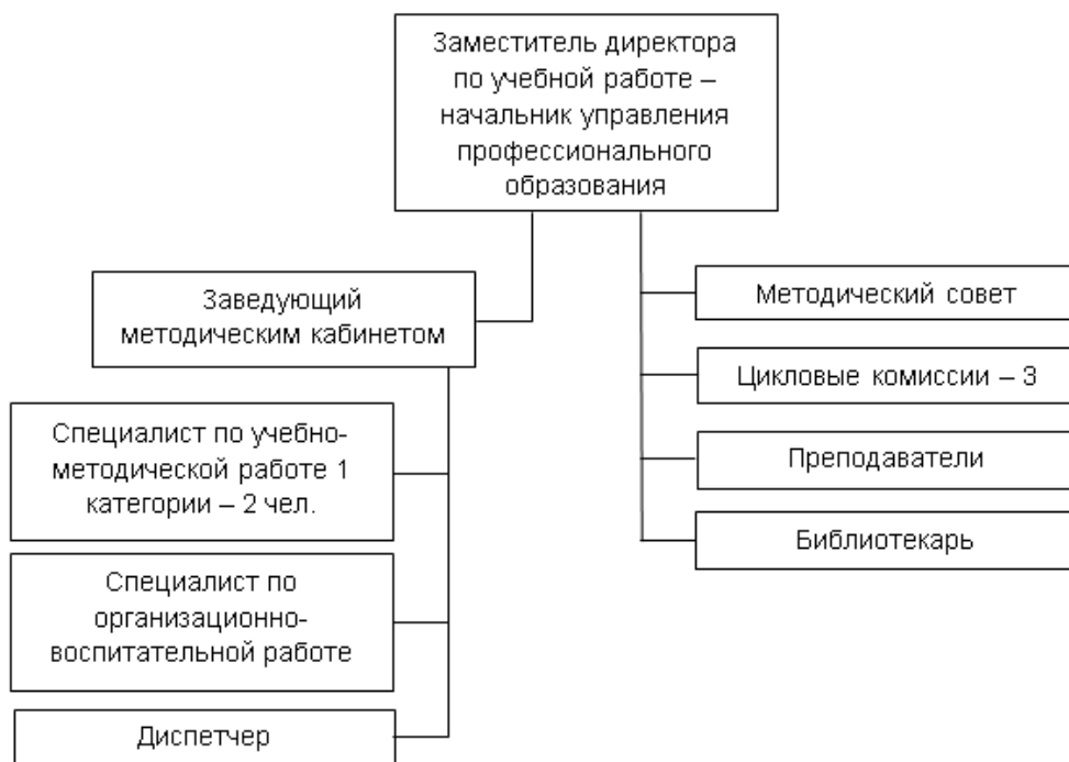
Рисунок 2 – Структура управления профессионального образования Хабаровского филиала СПбГУ ГА